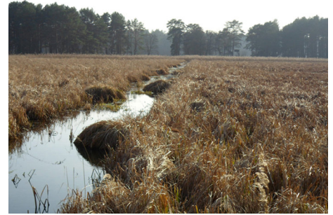
Blick auf den entwässernden Lotzingraben

Das Projekt zum „Wasserrückhalt zur Moorstabilisierung im Oberlauf des Trämmerfließes („Tranwiesen“) sowie im Großen Lotzinsees“ wird über das Programm Integrierte Ländliche Entwicklung (ILE) gefördert. Dies ist gemäß dem föderalen Aufbau der Bundesrepublik Deutschland die Umsetzung der ELER-Richtlinie (Europäischer Landwirtschaftsfonds für die Entwicklung des ländlichen Raumes) in Brandenburg.